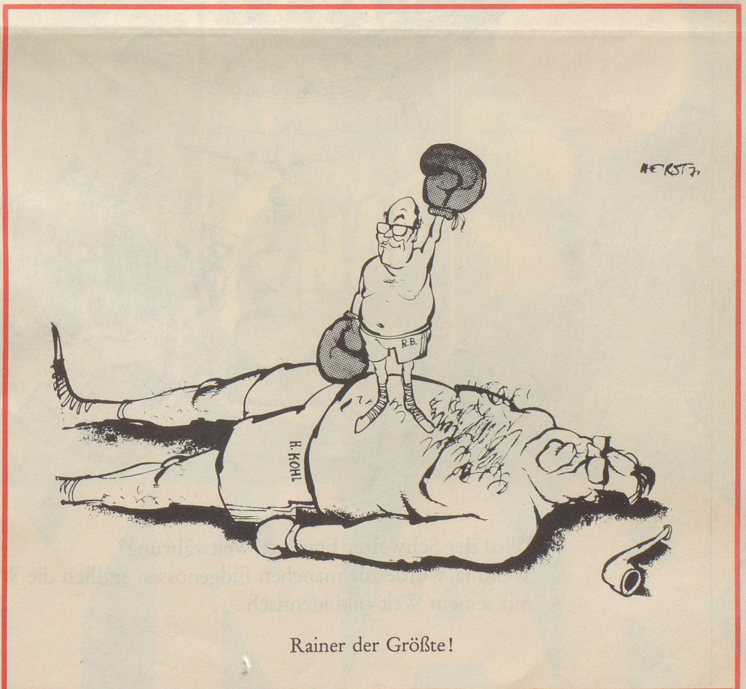
Rainer der Größte!