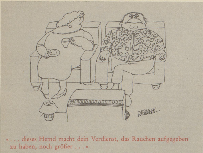
«... dieses Hemd macht dein Verdienst, das Rauchen aufgeben zu haben, noch größer...»