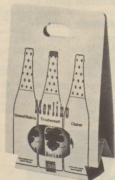
im 3er-Multipack Fr. 1.- billiger

Erhältlich in Lebensmittelgeschäften, Reformhäusern, Drogerien und durch unsere Depositäre.