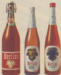
die drei beliebten Merlino Traubensäfte

Merlino Grand-Raisin , moussierender Traubensaft, 3 Flaschen im Multipack nur Fr. 7.85 statt Fr. 8.85. Merlino Clairet , rubinroter Traubensaft, 3 Flaschen im Multipack nur Fr. 7.85 statt Fr. 8.85. Merlino Literflasche , weiss und rot nur Fr. 2.65 statt Fr. 2.95 (plus Flaschenpfand).