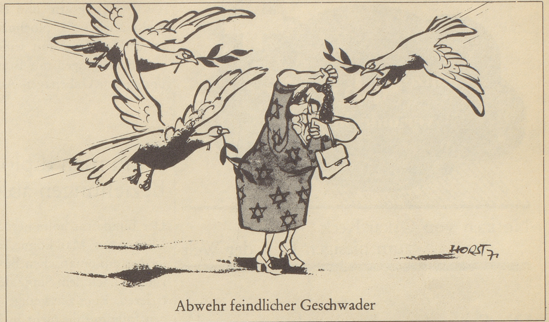
Abwehr feindlicher Geschwader