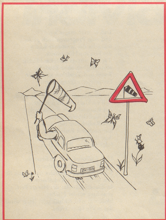
Fries Erich, Große Friedbergerstraße 10-12 Frankfurt / Main