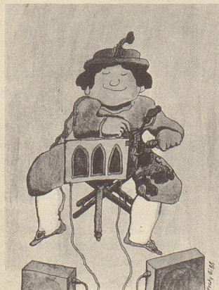
Fredy Sigg: Drehorgel (farbig)

Einen handsignierten Fredy Sigg — vgl. die stark verkleinerten Abbildungen unten — erhalten solange Vorrat alle, welche jetzt den Nebelspalter abonnieren. Benützen Sie für Ihre Geschenk- oder Eigenbestellung den untenstehenden Coupon!