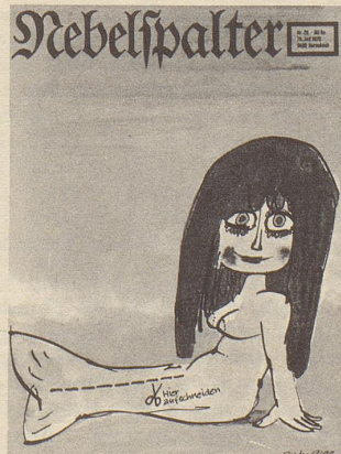
Fredy Sigg: Meernixe (farbig)

Hier ausschneiden und auf eine Postkarte geklebt oder in einem Couvert als Drucksache frankiert senden an: Verlag Nebelspalter, 9400 Rorschach.