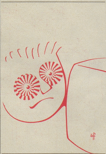
Alles Training – wenn erst die Medaillen kommen!