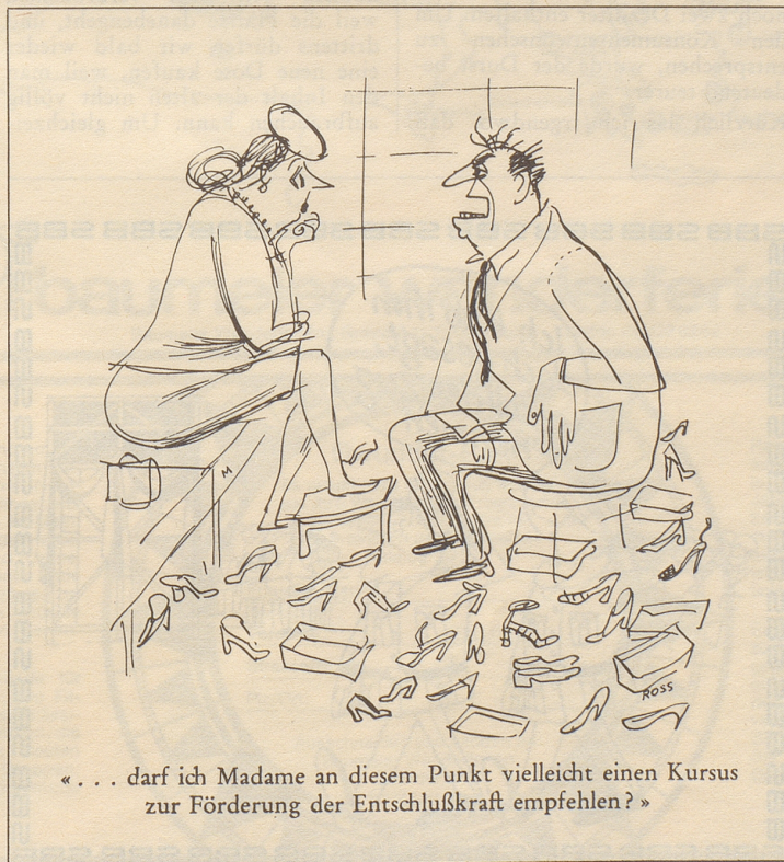
«... darf ich Madame an diesem Punkt vielleicht einen Kursus zur Förderung der Entschlußkraft empfehlen?»

Bilanz ziehend, stelle ich erleichtert fest, daß bei uns kein Auto, kein Weekendhaus, keine Safari in entlegene Kontinente, kein Perserteppich, keine Edelsteine, kein Picasso-Gemälde, kein Wertpapier oder ähnlich Fragwürdiges einen häßlichen Schatten auf das ideale