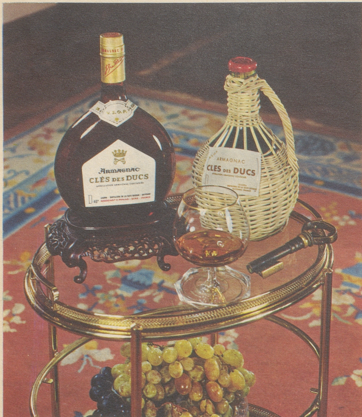
Armagnac CLES des DUCS, die Marke des Kenners

Generalvertretung: Emil Benz Import AG, 8037 Zürich