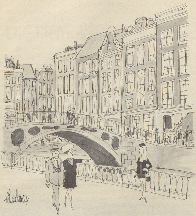
«Schau einmal! So etwas haben wir doch neulich in einem St.-Pauli-Film gesehen!»

WWF, sie versanken in der Arbeit, ob wir so nett wären... und ob wir vielleicht Zeit hätten, Adressen zu schreiben, nur ein paar hundert oder so... Mit der Post kam eine Einladung an meinen Mann; zweitägige Konferenz in Thun für Pilzexperten. Ich freute mich schon auf zwei Tage dolce far niente. Ja chasch dänke! Wie wenn sie es geahnt hätten, kreuzten zwei Damen auf vom Frauenverein: Sie hätten einen hübschen kleinen Basar zugunsten der Kinderkrippe, ob ich so nett wäre (schon wieder) und einen Stand betreuen würde. Ich bin natürlich so nett, weil ich gar keinen Grund habe, es nicht zu sein. Nächste Woche müssen dann noch dringend die Dahlienknollen versorgt und die Tulpen gesetzt werden. Aber nachher, wir garantieren, da machen wir Blauen! Wänn nüt derzwüsche chunnt! Mariann