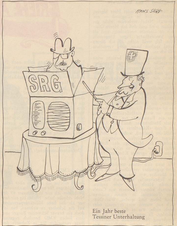
Ein Jahr beste Tessiner Unterhaltung

«Einer gewissen Presse zufolge soll ein neues Jahr angebrochen sein. Wie üblich sind solche Berichte mit der erforderlichen Vorsicht zu genießen. Eine Bestätigung steht noch aus. Die Bundesanwaltschaft ermittelt. Gerücheweise verlautete aus gewöhnlich gutunterrichteten Kreisen, in zahlreichen Ländern habe sich die Neuerung bereits durchgesetzt. Sollte diese inoffizielle Meldung den Tatsachen entsprechen, werden unsere höchsten Stellen gut daran tun, sich wieder einmal mit aller Deutlichkeit vor Augen zu halten, daß der «Sonderfall Schweiz» es nicht ohne weiteres zuläßt, ausländische Muster unbesehen zu übernehmen. In der Schweiz wird gegenwärtig geprüft, welche Modifikationen sich bei einer allfälligen Einführung dieser Regelung auf Bundesebene aufdrängen würden. Eine nationalrätliche Kommission ist beauftragt zu untersuchen, inwiefern die allgemeine Inkraftsetzung eines neuen Jahres mit den föderalistischen Prinzipien unseres Bundesstaates in Einklang zu bringen