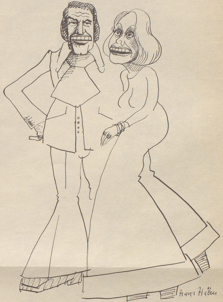
Auf großen Füßen leben

«Was?» schreit der Schotte. «So gehen Sie mit meinem Sohn um?!»