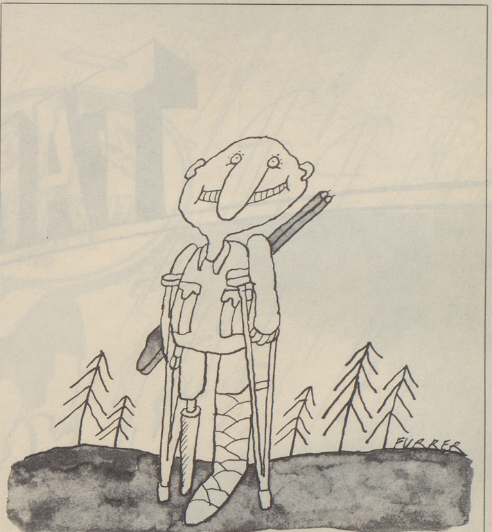
Zum Fuchsfang in Graubünden

«Also das mit den Tellereisen und den Schwanenhälsen für den Fuchsfang ist gar nicht so schlimm. Ich bin da zweimal hineingetreten und lebe immer noch ...»