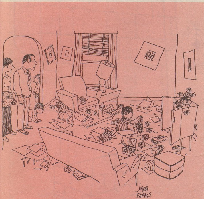
«Bei so viel schöpferischer Begabung unter dem eigenen Nachwuchs kann man nur bedauern, daß die Basler Kunstmesse nächstes Jahr quantitativ beschränkt wird...»