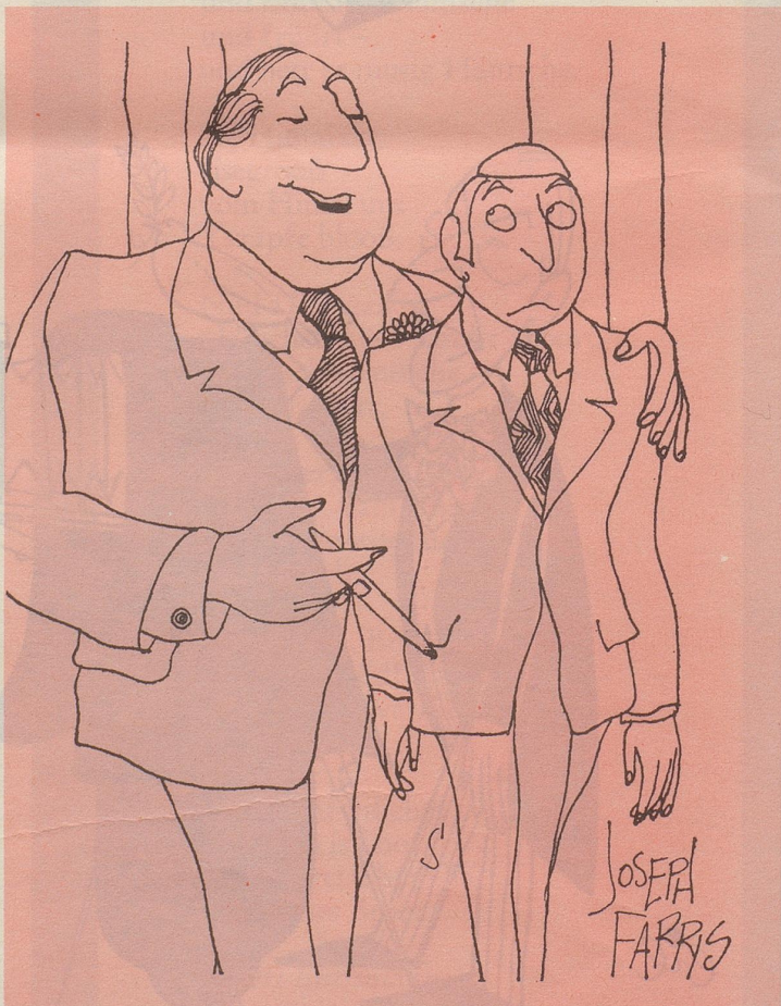
«Seien wir bloß auf den FC Basel und seinen Cubillas nicht eifersüchtig! Wenn die Presse uns weiterhin so anschwärzt, werden wir beim FCZ in der nächsten Saison sowieso lauter Neger im Einsatz haben!»