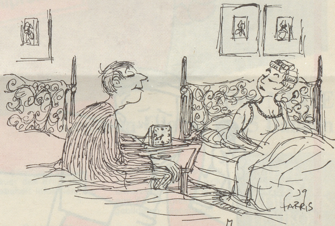
«Beim nächsten Béliet-Streich darf ich auch eine Petarde werfen!»

Gesehen, gelesen und geknipst! Ein guter Bibelspruch, der in löblicher Absicht an diesen Baum geheftet wurde. Ob der Mann aus Ettingen auch etwas gedacht hat, als er seine Einladung zum Grümpel-Turnier unter Jakobus 4, 17 angeschlagen hatte! Werner Perrenoud