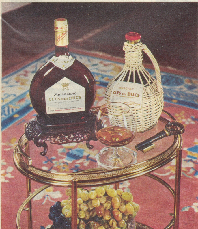
Armagnac CLES des DUCS, die Marke des Kenners

Generalvertretung: Emil Benz Import AG, 6340 Baar, Tel. 042 / 31 66 20