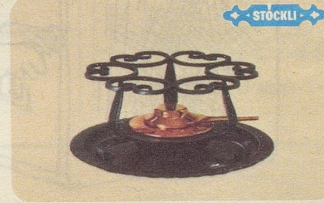
Réchaud, Nr. 7543, Fr. 52.—, für Fondue- und Flambierpfannen, Servierkasserollen, Pot-au-feu oder Bowlen.