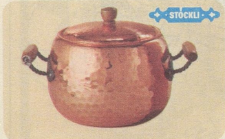
Bowle mit Deckel, Nr. 7745, Fr. 86.—, für Feuerzangen-Bowlen, Fleisch- und Fischsuppen oder Eintopfgerichte.

Alfred Stöckli Söhne, Metallwarenfabrik 8754 Netstal GL, Telefon 058/6125 25