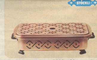
Plattenwärmer, Nr. 7592, 29 cm lang, Fr. 53.—, mit schmiedeisernen Füßen und Griffen, brüniert.