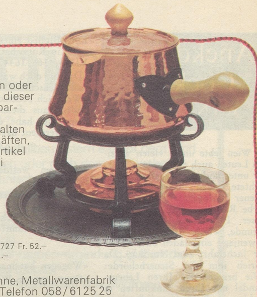
Burgunder-Garnitur «Beaune» Nr. 7731, Burgunder-Pfanne Nr. 7727 Fr. 52.— Réchaud Nr. 7547 Fr. 71.—

Wählen, wünschen oder schenken Sie eine dieser rotgoldenen Kostbarkeiten... Stöckli Kupfer erhalten Sie in allen Geschäften, welche Haushaltartikel führen. Die Stöckli Plombe bürgt für Echtheit.