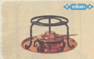
Réchaud, Nr. 7545, Fr. 48.—, für Burgunder-Pfannen und für die Türkische Kaffeekanne.