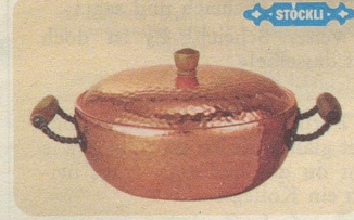
Pot-au-feu mit Deckel, Nr. 7835, Fr. 82.—, für Fleisch-, Fisch- oder Geflügel-Eintopfgerichte oder für Suppen.