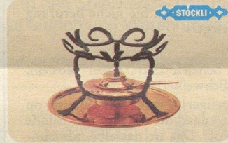
Réchaud «Körbli», Nr. 7549, Fr. 52.—, für Burgunder-Topf sowie für Burgunder-Pfanne. Neuartige Form, handgeschmiedet.