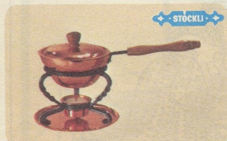
Butter- und Saucenwärmer, Nr. 7577, Fr. 50.—, Nr. 7575 Fr. 40.— (kleineres Modell)