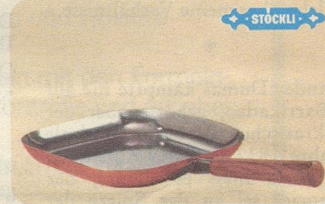
Steakpfanne «Lausanne», Nr. 7791, Fr. 55.50, speziell für Fleischgerichte, aber auch für Fische und Geflügel.