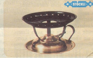
Réchaud, Nr. 7564, Fr. 35.—, für Käse-Fondue, brüniert, mit regulierbarem Sicherheitsbrenner.