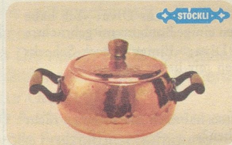
Burgunder-Topf mit Deckel, Nr. 7713, 16 cm Ø Fr. 43.—, 18 cm Ø Fr. 46.—, 20 cm Ø Fr. 51.—, ein sehr formschöner Topf.