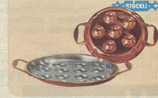
Schneckenpfanne, Nr. 7933, 6teilig Fr. 27.—, 12teilig Fr. 35.50.