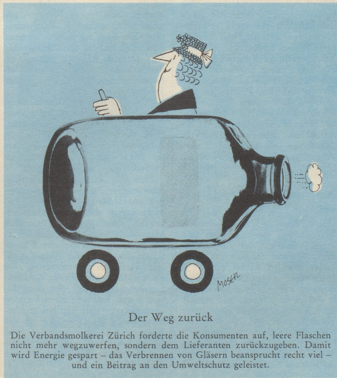
Der Weg zurück

Ich habe nämlich im «Bund» gelesen, dass die drei Dachverbände der Schweizer Frauen das