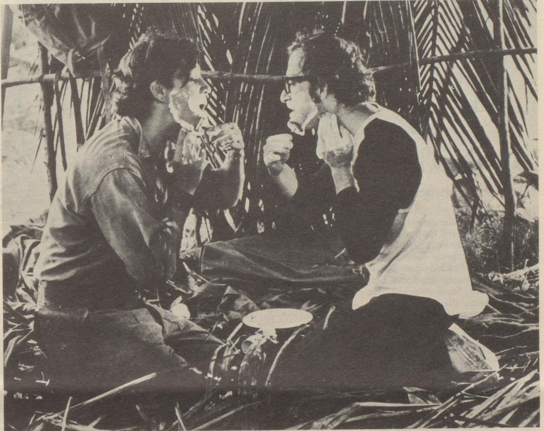
Woody Allen (rechts) in «Bananas»

Da ich also nur Gutes über «Bananas» hörte – in dem Sie als Vollblutkomiker nicht bloss die Hauptrolle spielen, sondern auch Regie führen und als Drehbuchautor zeichnen –, ging ich hin. Immer noch skeptisch, immer noch bereit, nach den ersten Anzeichen einer