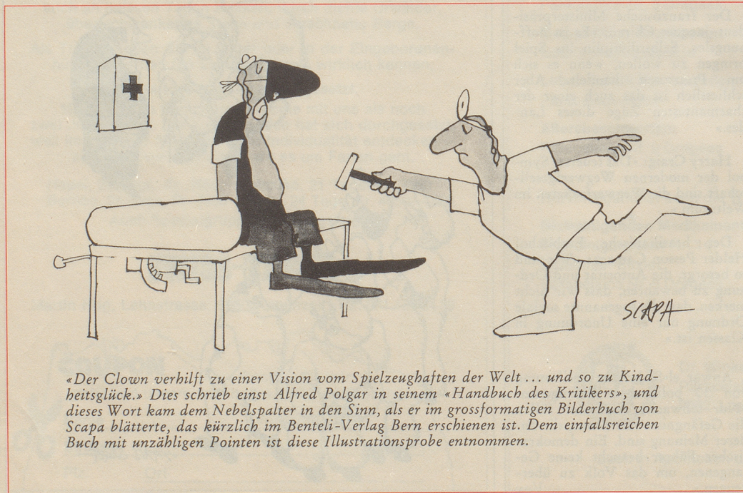
«Der Clown verhilft zu einer Vision vom Spielzeughaften der Welt... und so zu Kindheitsglück.» Dies schrieb einst Alfred Polgar in seinem «Handbuch des Kritikers», und dieses Wort kam dem Nebelspalter in den Sinn, als er im grossformatigen Bilderbuch von Scapa blätterte, das kürzlich im Benteli-Verlag Bern erschienen ist. Dem einfallsreichen Buch mit unzähligen Pointen ist diese Illustrationsprobe entnommen.

Als besondere kulturelle Tat wird in diesem Pressedienst die