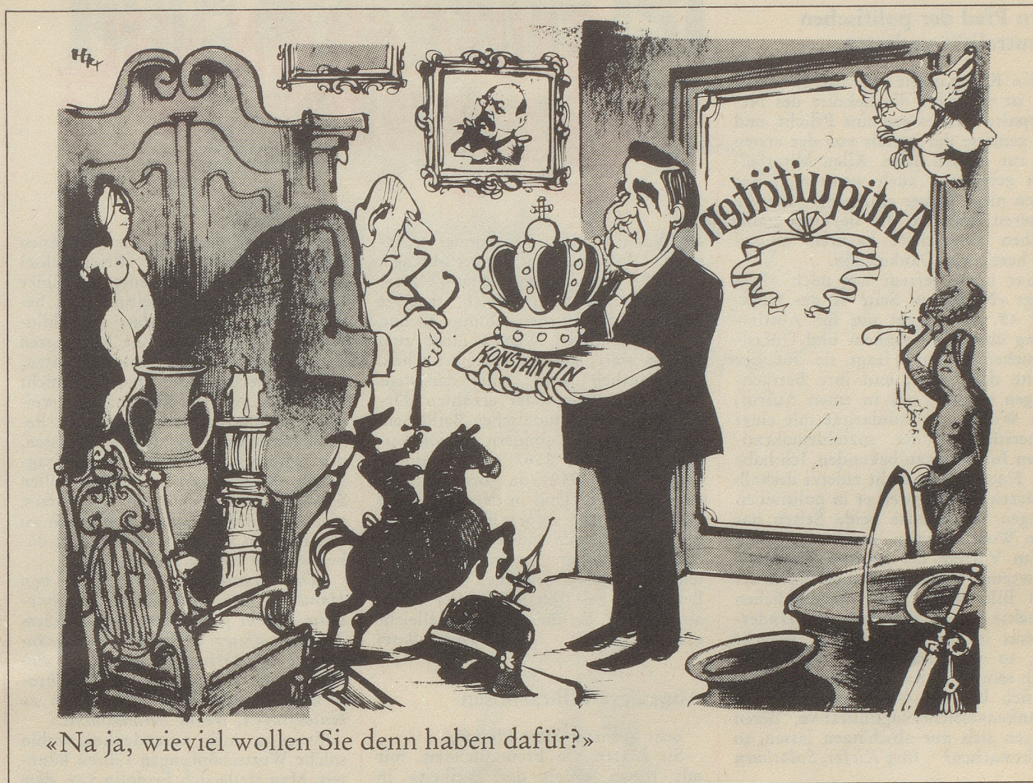
«Na ja, wieviel wollen Sie denn haben dafür?»