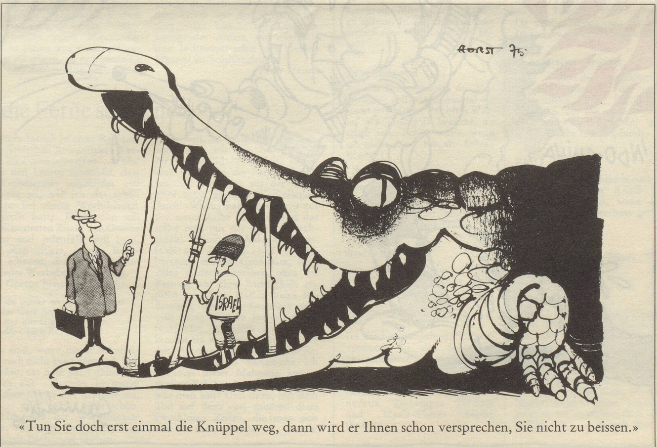
«Tun Sie doch erst einmal die Knüppel weg, dann wird er Ihnen schon versprechen, Sie nicht zu beißen.»