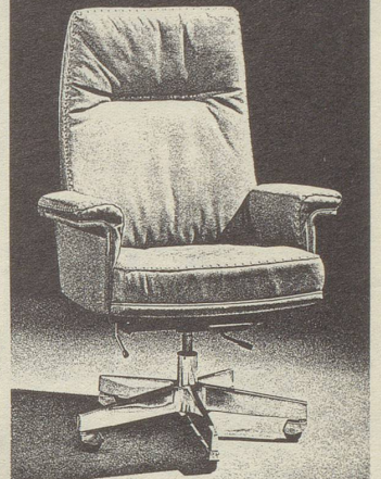
De Sede AG, 5313 Klingnau