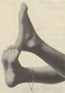
oder kleine flinke...