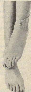
und chronisch kalte...