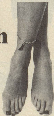
Ob nun zwei linke...

Allen Füissen frisch getan ist eine Kunst, die yegi kann.