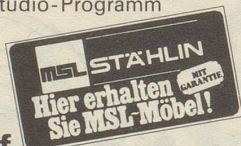
Bild: MSL-Studio-Programm beliebig zusammenstellbar

Über Geschmack lässt sich streiten. Darum haben wir in unserer grossen Ausstellung ein umfangreiches Angebot in den verschiedensten Stilarten ausgestellt. Hier finden auch Sie das Möbel, welches Ihren besonderen Vorstellungen entspricht. Auch eine Riesenauswahl an Orient- und Spannteppichen, Polstergruppen, Lampen, Einbauschränken und allem, was zum Wohnen gehört, macht unsere Fabrik-Ausstellung sehenswert.