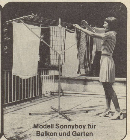
Modell Sonnyboy für Balkon und Garten