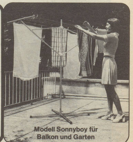
Modell Sonnyboy für Balkon und Garten

Gölg Ade AG, Metallbau, 8050 Zürich, Siewerdstrasse 95, Telefon 01 - 46 70 44