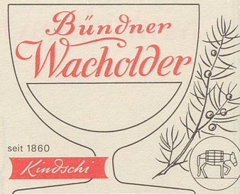
DESTILLERIE KINDSCHI SÖHNE AG DAVOS

Insofern ist die Anonymität eine Tragsäule der Gesellschaft. Man kann «eine Kompanie» Soldaten in den Tod schicken, kann «zwanzig Prozent» der Belegschaft ent-