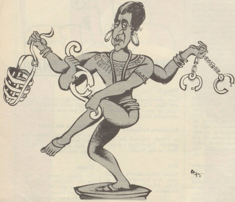
Indischer Shiwa, 20. Jahrhundert