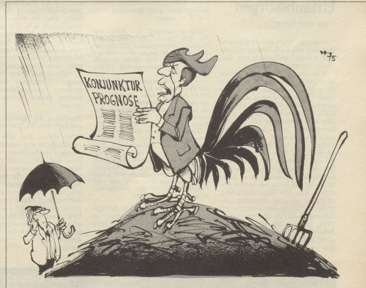
Wenn der Hahn kräht auf dem Mist, ändert sich das Wetter oder es bleibt wie's ist!