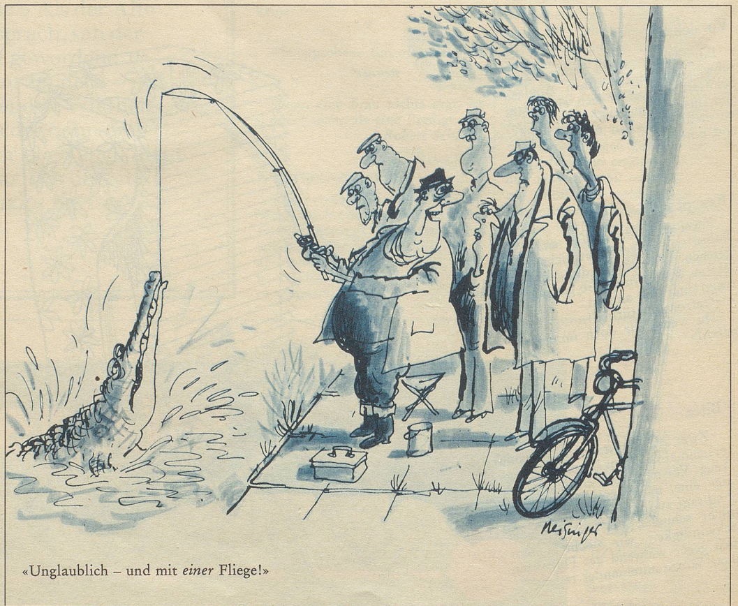
«Unglaublich – und mit einer Fliege!»

Man wäre es doch der célébrité des mondialement bekannten Namens schuldig, jede dieser Fragen geistsprühend zu beantworten, den