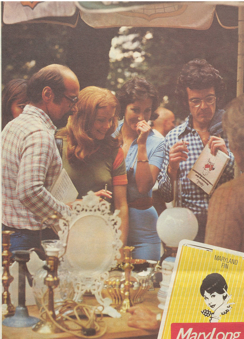
Eine Mary Long-Länge lang feilschen ist auch ein Vergnügen.