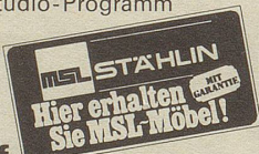
Bild: MSL-Studio-Programm beliebig zusammen- stellbar

Über Geschmack lässt sich streiten. Darum haben wir in unserer grossen Ausstellung ein umfangreiches Angebot in den verschiedensten Stilarten ausgestellt. Hier finden auch Sie das Möbel, welches Ihren besonderen Vorstellungen entspricht. Auch eine Riesenauswahl an Orient- und Spannteppichen, Polstergruppen, Lampen, Einbauschränken und allem, was zum Wohnen gehört, macht unsere Fabrik-Ausstellung sehenswert.