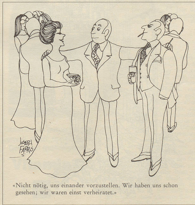
«Nicht nötig, uns einander vorzustellen. Wir haben uns schon gesehen; wir waren einst verheiratet.»