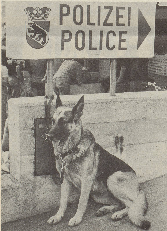
Der Polizeihund persönlich?