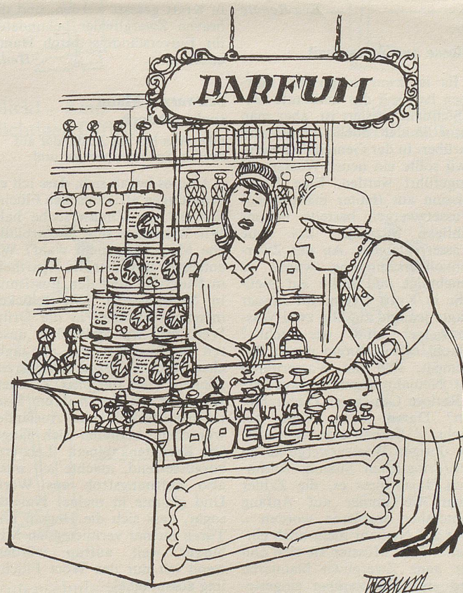
«Import aus der Sowjetunion!»

Muss denn dieses Soft-Ice, so frage ich mich, wirklich ausnahmslos überall, selbst im dichtesten Gedränge geschleckt werden? Aber eben, fasst eine derartige Sitte einmal Fuss, dann sorgt der Nachahmungstrieb sehr