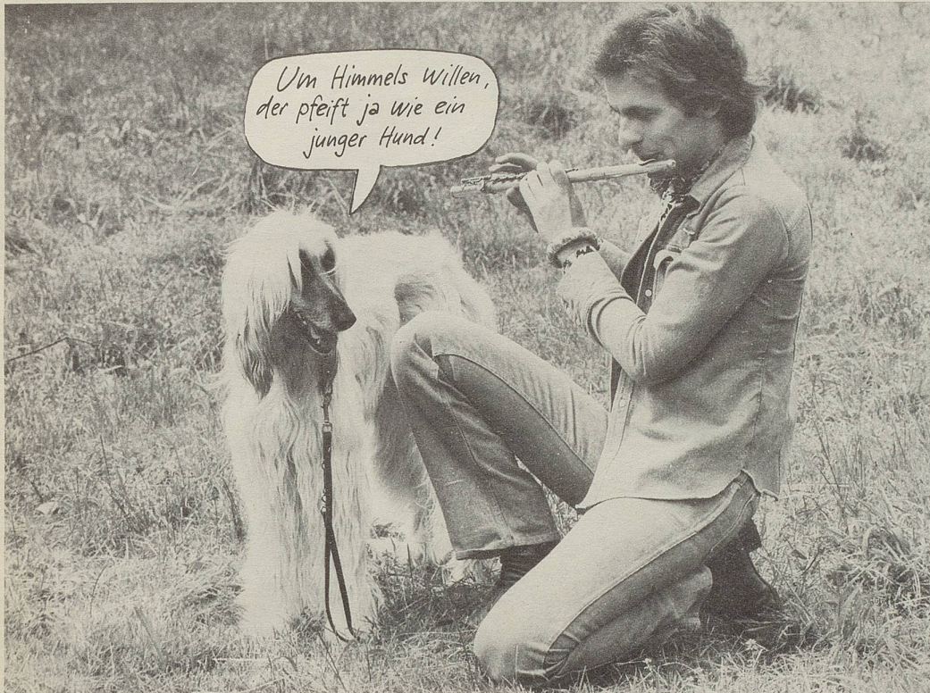
Bandleader Pepe Lienhard mit seinem Hund