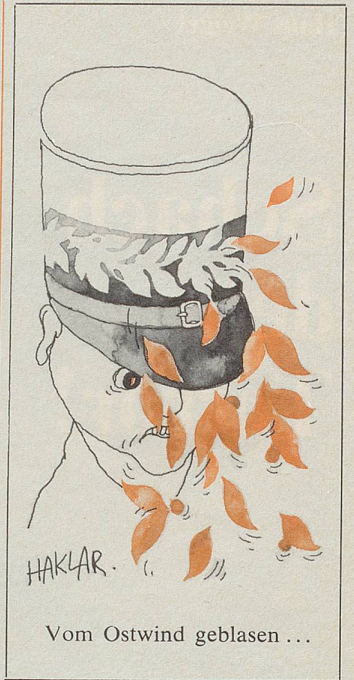
Vom Ostwind geblasen ...

Zum Vorwurf des Angsteinjagens wäre festzustellen, dass andere Tatsachenberichte – auch aus der Tagesschau – über Krieg, Aufstände etc. oft grauenvoll sind, aber eben, weiter weg. In der unmittelbaren Nähe sollte die Welt möglichst heil bleiben. Es wehrt sich scheinbar auch niemand gegen die im Schweizer Fernsehen noch und noch gezeigten amerikanischen 20jährigen Krimifilme (oft am Sonntagabend). Solch flache Unterhaltung reizt of-