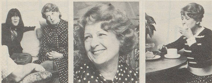
... beim Sprechen