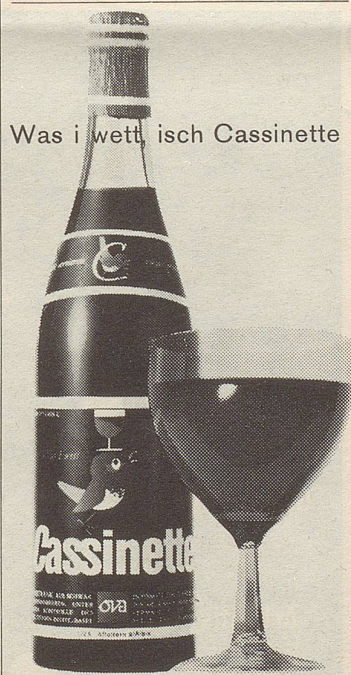
Was i wett, isch Cassinette

Cassinette ist gesundheitlich wertvoll durch seinen hohen Gehalt an fruchteigenem