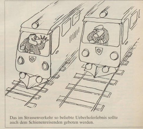
Das im Strassenverkehr so beliebte Ueberholerlebnis sollte auch dem Schienenreisenden geboten werden.