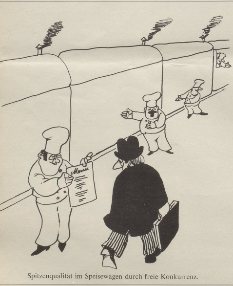
Spitzenqualität im Speisewagen durch freie Konkurrenz.