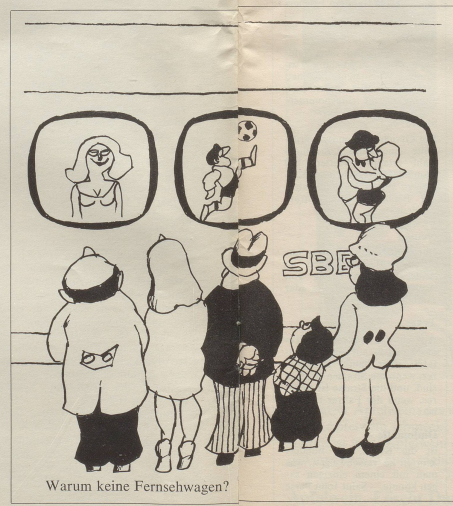
Warum keine Fernsehwagen?