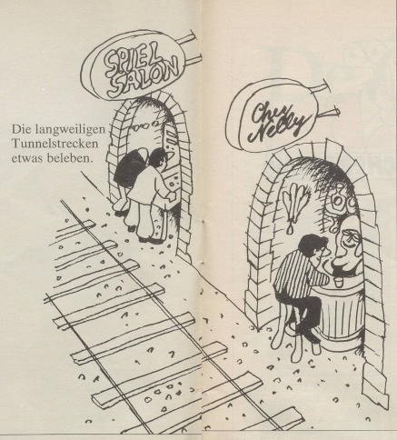
Die langweiligen Tunnelstrecken etwas beleben.