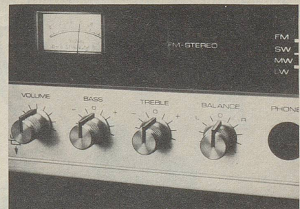
HiFi-Stereo-Receiver mit grossen Leistungsreserven

Modernste Technik garantiert hohe Betriebssicherheit. Uebersichtliche Skalen und Instrumente machen die Handhabung bei dieser Anlage einfach und zuverlässig.