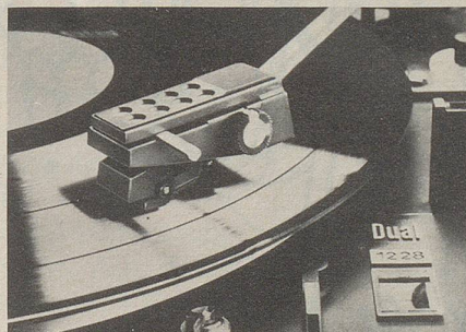
HiFi-Automatikspieler Dual 1228 mit hohem Bedienungskomfort.

«Dolby»-Rauschunterdrückungssystem — Dreifach-Bandsortenschalter — Hart-Permalloy-Tonkopf mit extremer Lebensdauer — vier getrennte Aussteuerungsregler, mischbar — automatische Aussteuerungsbegrenzung (Limiter), abschaltbar — Memory-Bandlängenzählwerk.