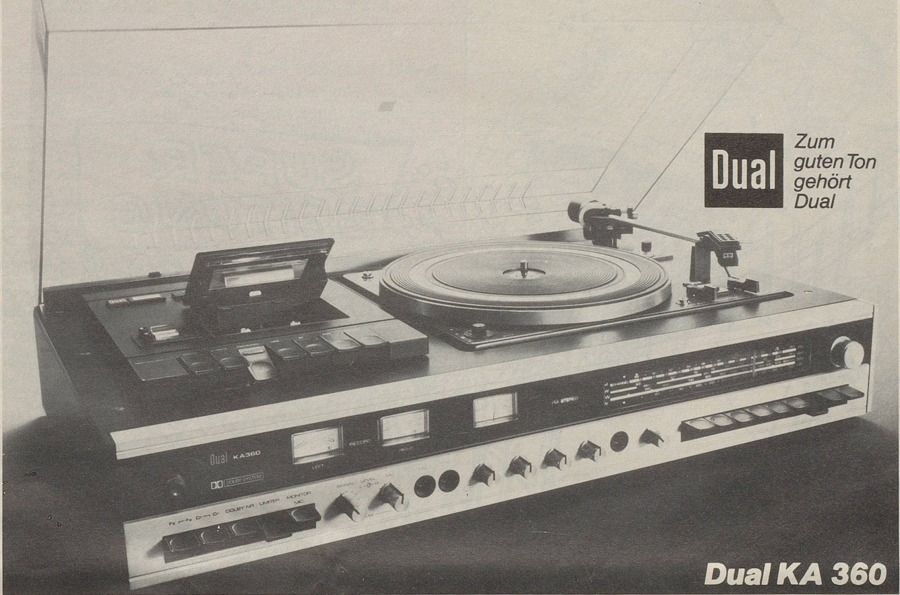
Dual KA 360