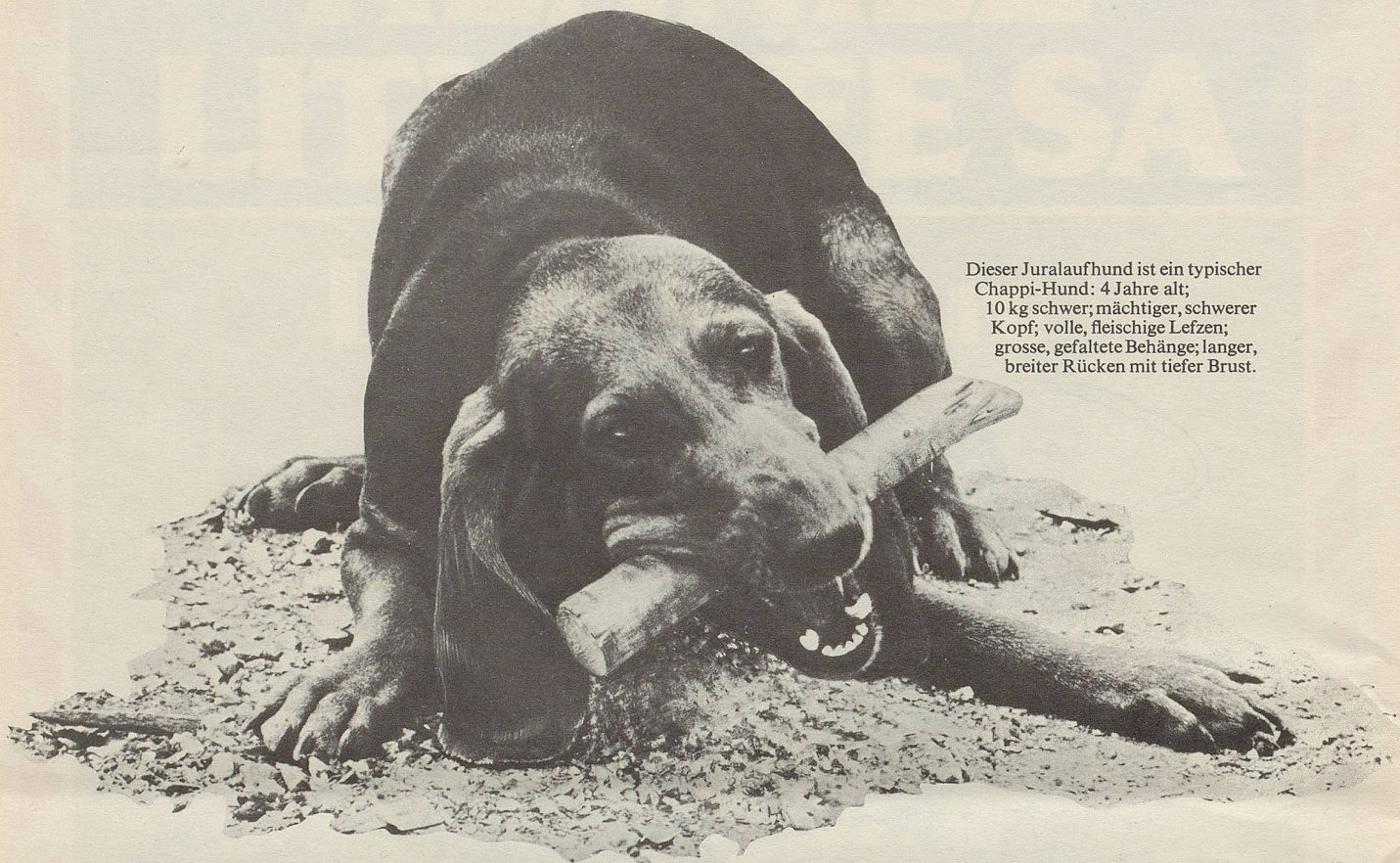
Dieser Juralaufhund ist ein typischer Chappi-Hund: 4 Jahre alt; 10 kg schwer; mächtiger, schwerer Kopf; volle, fleischige Lefzen; grosse, gefaltete Behänge; langer, breiter Rücken mit tiefer Brust.