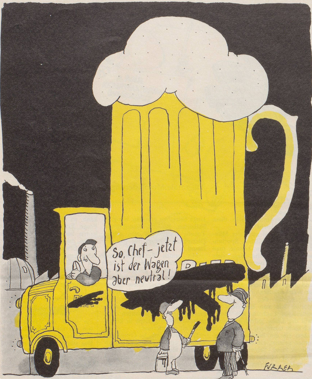
Ab 1. März ist in Finnland die Alkoholwerbung verboten. Das neue Gesetz schreibt sogar den Brauereien «neutrale» Lieferwagen vor, damit die Namen bekannter Getränke nicht zum Konsum anregen.