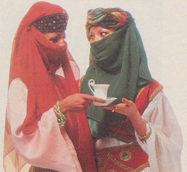
Die 999. Haremsdame lädt die 1000. Haremsdame zu einem Tässchen INCAROM ein.