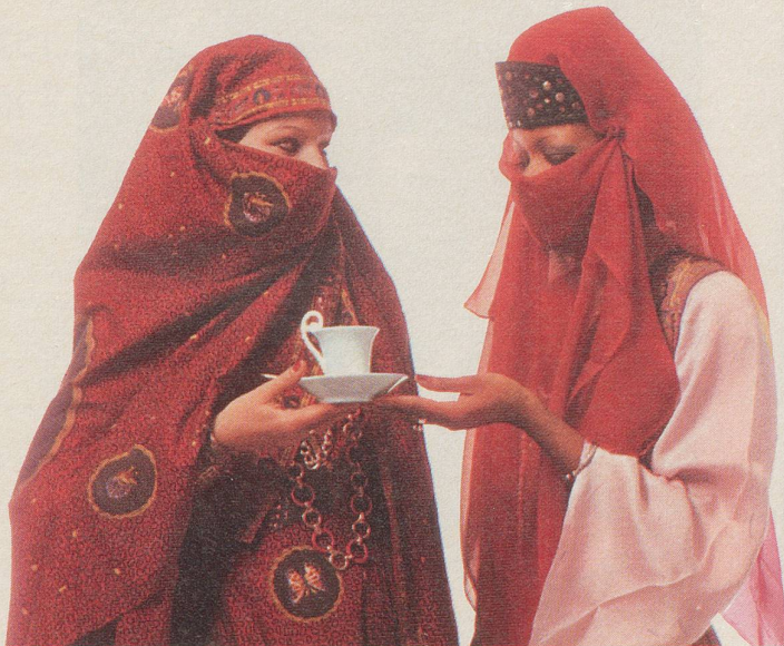
Die 998. Haremsdame lädt die 999. Haremsdame zu einem Tässchen INCAROM ein.