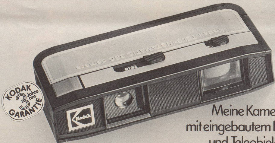
Meine Kamera, mit eingebautem Normal- und Teleobjektiv.