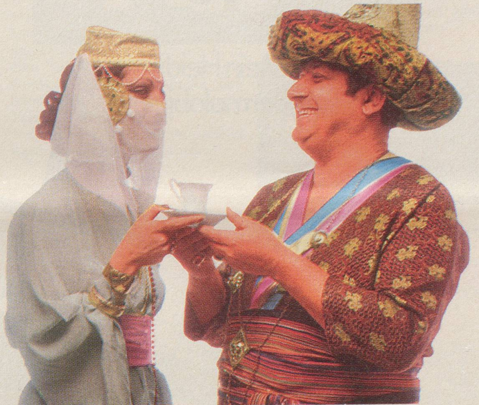
Die 1001. Haremsdame lädt den Kalif von Olten zu einem Tässchen INCAROM ein.

Wen lädt der Kalif von Olten zu einem Tässchen INCAROM ein?