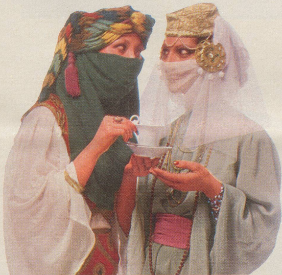
Die 1000. Haremsdame lädt die 1001. Haremsdame zu einem Tässchen INCAROM ein.