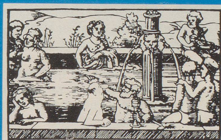
Kurorte gestern und heute – belächelt und karikiert von Hans Moser