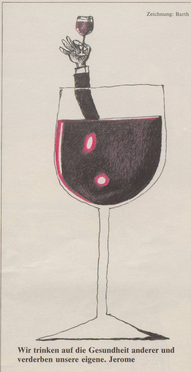
Wir trinken auf die Gesundheit anderer und verderben unsere eigene. Jerome