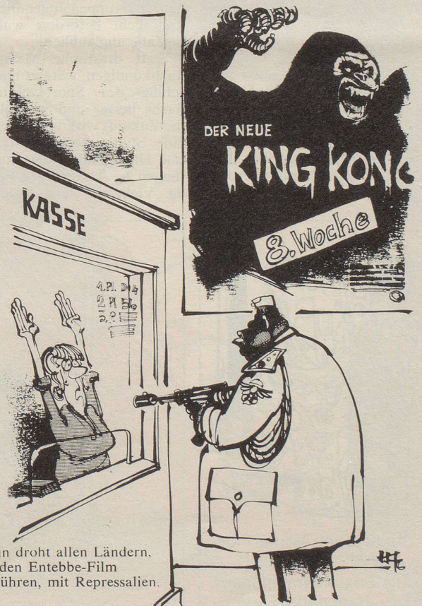
Amin droht allen Ländern, die den Entebbe-Film aufführen, mit Repressalien.