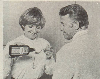
Zellerbalsam - seit über hundert Jahren das Hausmittel gegen Magen- und Darmbeschwerden.

Sein Rat ist nicht zu ersetzen. Wenn Sie sich fragen, ob Sie bei einem Unwohlsein besser Ihren Arzt aufsuchen sollten, tun Sie es!