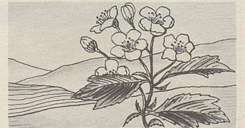
Fructus Crataegi, eine der Heilpflanzen, deren Extrakte in Zellers Herz- und Nerventropfen enthalten sind (nach Prof. Hörhammer).

Naturkräfte der Pflanzen werden auch wohltuend aktiv bei Herzklopfen, raschem Puls, Beklemmungsgefühl, bei Nervosität, Reizbarkeit und Atemnot. So verdanken Zellers Herz- und Nerventropfen ihre Heilerfolge unter anderem Extrakten aus Blüten, Blättern und Früchten des Crataegus (Weissdorn). Zellers Herz- und Nerventropfen besänftigen die gereizten Nerven und lassen das Herz wieder ruhiger schlagen.