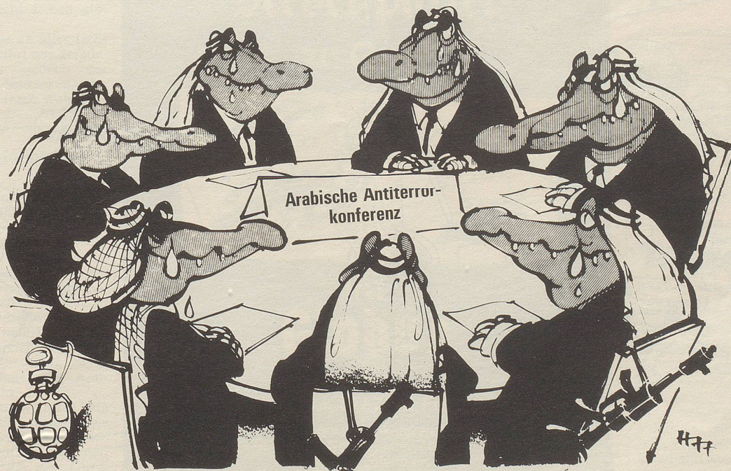
«... Noch jemand einen Vorschlag zur Bekämpfung bössartiger Raubtiere?»