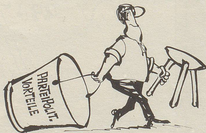
«Hat doch alles auch sein Gutes!»