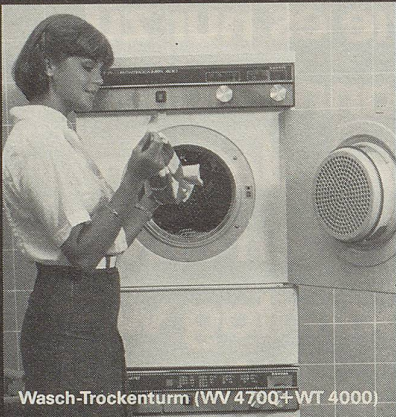
Wasch-Trockenturm (WV 470Q+WT 400)